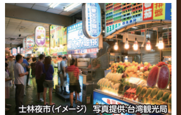
士林夜市(イメージ)