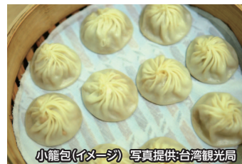
小籠包(イメージ)

小籠包で有名な名店「鼎泰豊」にて飲茶をお召し上がりいただけます。また、夕食後には希望者の方を台北最大の夜市「士林夜市」にご案内いたします。