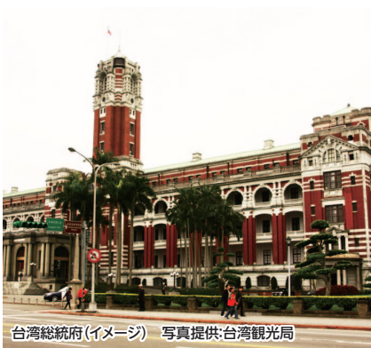
台湾總統府(イメージ)

台湾行政の中核、日本統治時代を象徴する建物です。後藤新平が提唱し建設、1912年着工1919年完成と7年の歳月をかけて日本政府の台湾總督府として建築しました。設計は辰野金吾(東京駅・旧岩手銀行本店本館設計)の弟子、長野宇平治です。ここでは、専用ガイドにより台湾の歴史と民主化、日本統治の状況を学びます。