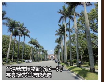
台湾糖業博物館(イメージ)

新渡戸稲造の台湾に残した偉業を訪ねます。製糖業は1952年～1964年にかけて台湾の主要な産業になり砂糖が国外販売品でトップを占めていました。その製糖業の基礎を作ったのは農業経済学博士でもある新渡戸稲造でした。当時の事務所や工場内は博物館として見ごたえのある建造物となっています。